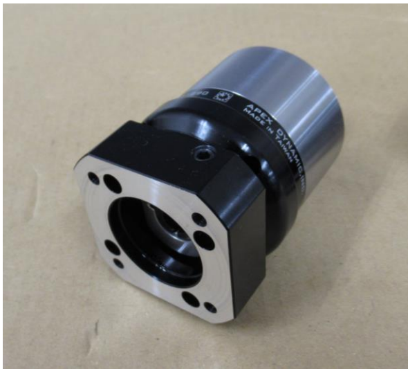
写真2 新仕様アダプタ (面取り無)