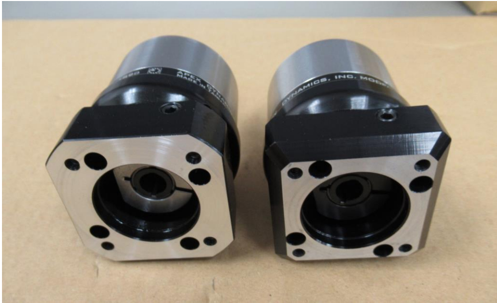
写真1 アダプタ形状変更概要 (AE050-1 段、左：新仕様、右：旧仕様)